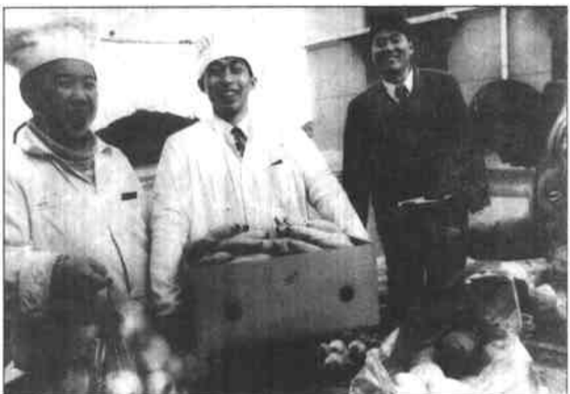
市劳动大厦全体职工为让参加会议的政协委员居住得满意,采取周密措施,以提高服务质量,他们还指定专门人员,定点采购果品、蔬菜等食品,确保新鲜、卫生。

(上接第一版)深入基层,了解反映社情民意,积极主动地做好解释疑惑、理顺情绪、化解矛盾、鼓舞士气的工作。政协内部要充分发扬民主,允许发表不同意见,造成一种知无不言、言无不尽的宽松气氛;三是深入学习政治理论,重视发挥理论的指导作用。首先要在认真学习领会邓小平理论的精神实质上下功夫,同时要认真学习老一辈无产阶级革命家和江泽民同志对人民政协工作的重要指示和论述,坚定正确的政治方向。要紧密联系群众,认真学习贯彻市委、市政府的重要工作部署,努力使政协工作始终围绕党委、政府的中心任务展开;四是进一步加强与委员的联系,发挥政协委员在履行职能中的主体作用。政协的活力和生气在于委员。要不断密切与委员的联系,市政协社委会主席、副主席、秘书长、副秘书长至少每人联系30个委员,经常不断地当面听取委员的意见和建议。政协开展的调查视察活动尽量多吸收委员参加。(记者 徐纯亮)