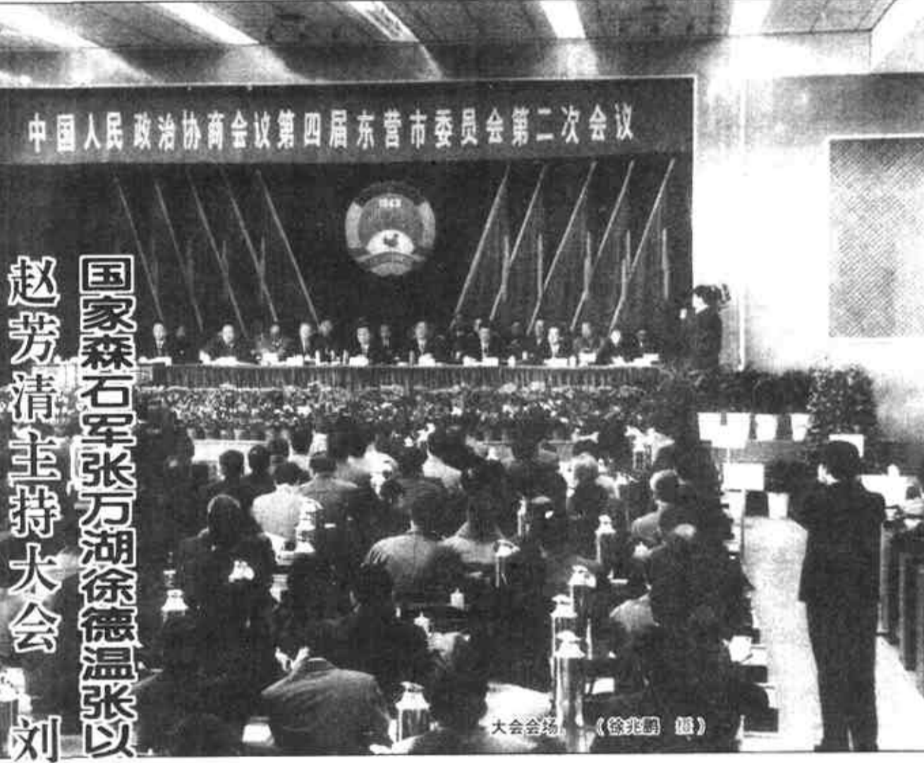
大会会场