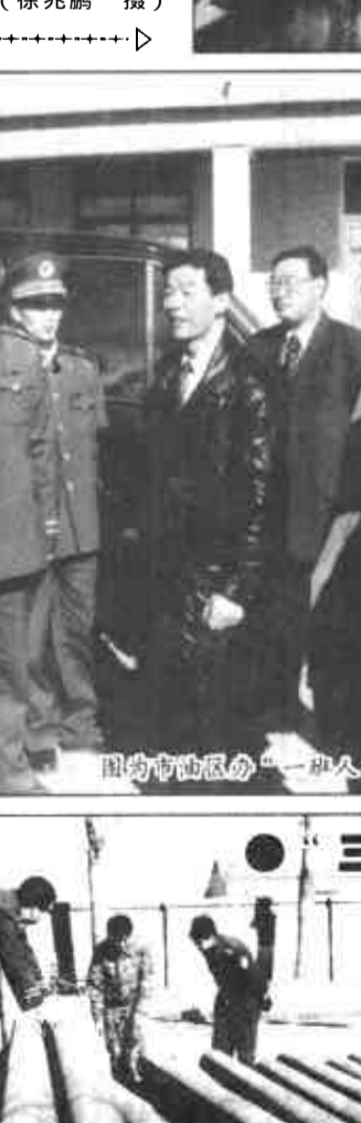
图为市油区办“三讲”教育剪影