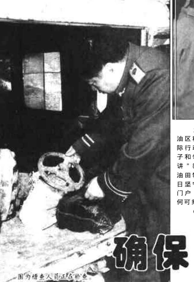
图为检查人员正在检查

河口区把创建科技示范基地活动的目标量化为组织建设、经济发展、精神文明建设三大指标,层层分解到人,为群众提供产、供、销一条龙服务,并将这一活动情况纳入领导干部的年度目标和任期目标考核,调动了党员干部的积极性。去年11月份,区委组织部、区科委等部门在义和镇组织举办了基层党员干部果树技术比武大会,观摩群众达3000余人,深受群众欢迎。新户乡老鸦村是河口区选树的电教科技示范基地,每年举办果树科技讲座10余次,去年,仅林果一项全村收入达300万元,人均占有2300余元。目前,全区村级党员电教播放点达178个,设点率达100%,仅去年一年,全区共播放电教科技片6426场次,受教育群众达2.6万人次,有效地提高了农民群众的科技素质,促进了农村经济的发展,1998年,全区农民人均纯收入达到了2303元,比上年增长55.7%。(胡友文 王玉广)